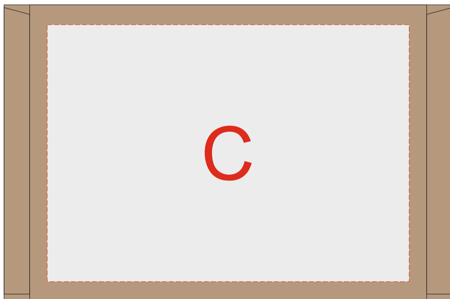
коробка, вид сверху